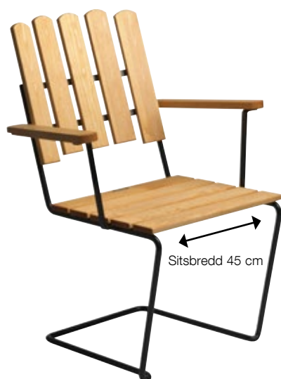
Monteringshöjd ryggribbor, överkant järn

Från 1963 och fram till dagens modell används en rundvalsad stång (Ø16 mm). Samtidigt med övergången till rundstång 1963 fick Fåtölj A2 en nättare storlek. Till stativ tillverkade av rundstång passar träsats 45 cm.